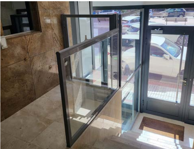
■ Puerta grande abajo | puerta pequeña arriba