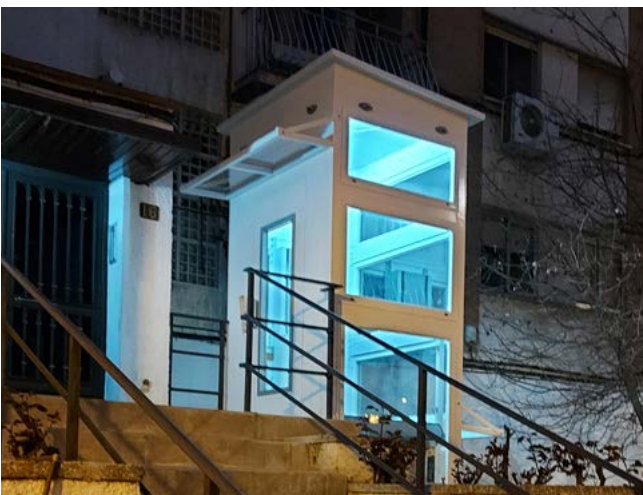
■ Para exterior con estructura